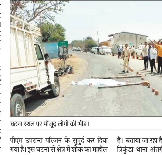
घटना स्थल पर मौजूद लोगों की भीड़।

अंबिकापुर। बलरामपुर जिले के त्रिकुंडा थाना क्षेत्र में रविवार की सुबह तेज रफ्तार ट्रेलर के काल बनकर युवक की जान ले ली। काम करके वापस घर लौट रहे बाइक सवार युवक को गांव के समीप ही ट्रेलर ने कुचल दिया। इस घटना में युवक की मौके पर ही मौत हो गई। घटना के बाद चालक वाहन लेकर मौके से फरार हो गया। इधर इस घटना के बाद आक्रोशित परिजन व ग्रामीणों ने सड़क पर शव रखकर चक्का जाम कर दिया और दुर्घटना कारित करने वाले वाहन को पकड़ने की मांग की। सूचना पर पहुंची पुलिस व प्रशासनिक अधिकारियों की टीम द्वारा समझाईस देकर मामला शांत कराया इसके साथ ही चंदौरा घाट से ट्रेलर को पकड़ने में सफलता हासिल की। पुलिस द्वारा शव को