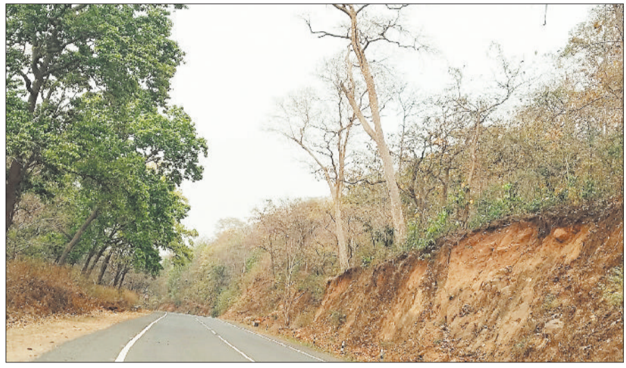
एनएच सड़क के बगल में झूके पेड़।

जिले के बैकुण्ठपुर-मनेन्द्रगढ़ राष्ट्रीय राजमार्ग पर नगर गांव के आगे जामदुआरी जंगल में हादसे को दावत देते पेड़ प्रशासन की लापरवाही को उजागर कर रहे हैं। सड़क किनारे कई पेड़ अपनी जड़ों से उखड़ने की कगार पर हैं, जो कभी भी गिर सकते हैं। मिट्टी कटाव और बारिश के दौरान भूस्खलन से यह इलाका और भी खतरनाक हो जाता है, इसके बावजूद जिम्मेदार विभाग आंख मूंदे बैठे हैं। यह सड़क कोरिया जिले को अंबिकापुर और अन्य बड़े शहरों से जोड़ती है। हर दिन हजारों वाहन यहां से गुजरते हैं, इनमें बसें, ट्रक, हेबुलेंस और आम राहगीर शामिल हैं। तेज हवा चलने या बारिश होने पर इन पेड़ों के गिरने का खतरा और बढ़ जाता है। पिछले कुछ सालों में यहां कई हादसे हो चुके हैं, लेकिन प्रशासन की सुस्ती बरकरार है। उल्लेखनीय है कि बरसात के मौसम में इस इलाके में भू-स्खलन की घटनाएं आम हैं। मिट्टी का कटाव होने के कारण शोष पेज 4 पर