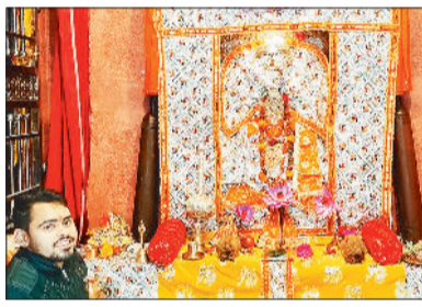
हरिभूमि न्यूज | मनेन्द्रगढ़

श्री हनुमान जन्मोत्सव एक विशेष और पावन पर्व है, जो प्रत्येक वर्ष भगवान हनुमान के जन्मदिन के रूप में मनाया जाता है। इस अवसर पर भक्तगण भगवान हनुमान की पूजा-अर्चना, भक्ति गीतों और धार्मिक आयोजनों में भाग लेकर अपने जीवन को पुण्य से ओत-प्रोत करते हैं। इस बार श्री हनुमान जन्मोत्सव का आयोजन 12 अप्रैल को श्री-श्री विजय हनुमान टेकरी (फलाहारी बाबा मंदिर), श्री संकट मोचन धाम सिरौली, श्री दक्षिण मुखी हनुमान मंदिर स्टेशन रोड, हनुमान मंदिर वाई नंबर 12, श्री हनुमान मंदिर नेशनल हाइवे, श्री हनुमान मंदिर खेड़िया टाकीज तिराहा समेत सभी मंदिरों में किया जाएगा। श्री हनुमान जन्मोत्सव का मुख्य आकर्षण भंडार का